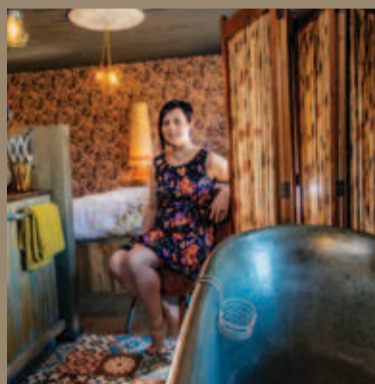
NELE UIT HALEN

"Ik ben constant op zoek naar leuke interieurstukjes. Ons huis is een combinatie van retro aangevuld met moderne accenten. Wekelijks spring ik wel eens binnen in de Kringwinkel, uiteraard kom ik niet altijd met iets buiten, maar een aantal vondsten waar ik best trots op ben zijn een paravent, een aantal lampen en oude kastjes."